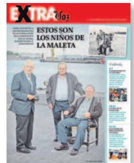
Portada de la revista

En la revista se incluyen también otros temas de actualidad, como la historia de los dos boxeadores más ricos del mundo,